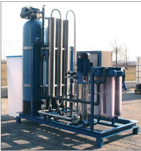
Installation osmose inverse.