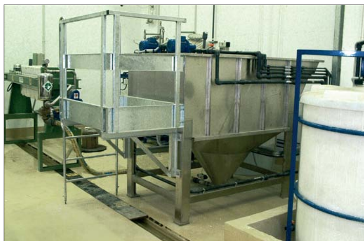
Installation physico-chimique pour les eaux de rinçage d'une ligne de dégraissage-phosphatation.