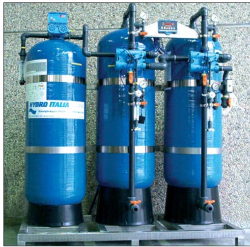
Démminéralisation automatique Q= 3 m³/h.

déchets ainsi que les principes de précaution que l'on doit adopter pour l'environnement, ce procédé de "fosse de relargage" présente désormais quelques inconvénients notables :