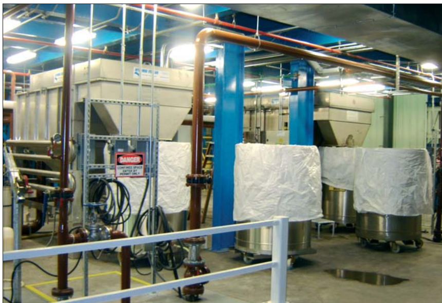
Traitement par flottation des eaux souillées de peintures.

Dénaturer signifie transformer la peinture ayant des caractères adhérent et colorant en particules totalement inertes, comparables à du "sable fin en suspension". Pour obtenir cette réaction de dénaturation, on utilise un produit approprié dont on prend un soin extrême à le mêler complètement à l'eau : le coagulant. Il s'agit aussi d'empêcher la formation de croûtes ou l'encrassement des tuyaux et des pompes, même si les particules de peinture dénaturées retournent dans la zone du rideau d'eau. Hydro Italia prend là un soin tout aussi extrême à conseiller sur le process de circulation des eaux souillées.